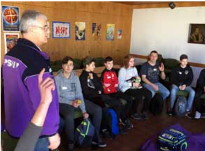
Konfitag im Speratushaus