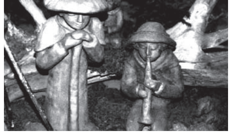
Bild von dem zu machen, wovon sie gehört haben. Dass sie gehen, um zu sehen, was da geschehen ist. Dass sie der Unterbrechung ihres Alltags Raum geben, so dass die Erscheinung der Engel eine Wirkungsgeschichte bekommt, zur Erfahrung und zum Gotteslob wird.

Kennen Sie in Ihrer Lebensgeschichte auch solche Unterbrechungen? Momente, in denen aus einer normalen Nacht eine besondere wird, aus einer alltäglichen Unterhaltung ein wegweisendes Gespräch? Situationen, in denen das Leben unerwartet eine beglückende Tiefe erfährt? Gelegenheiten, die zur Gotteserfahrung werden können?